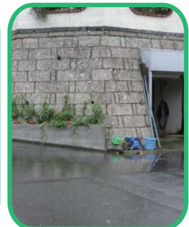
改修をしたいけど手を付けられない

大谷石は軽石擬灰岩とも言われ、古来から建材として使用されている素材です。珪酸・酸化アルミニウム・酸化マンガン・第二酸化鉄・カリウム・ナトリウム・酸化マグネシウム等で形成されている擬灰岩であり、耐火性や石質が柔らかい為、外構、擁壁、石塀などに使用されております。