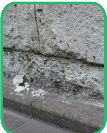
大谷石の表面がかけおちている